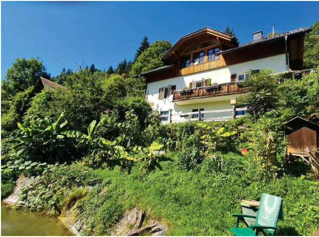
Haus u. Biotop