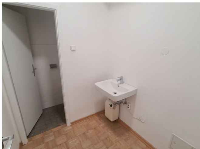
Waschraum / WC